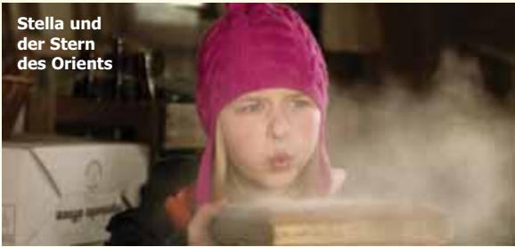
Stella und der Stern des Orients