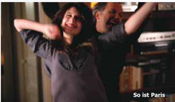
So ist Paris